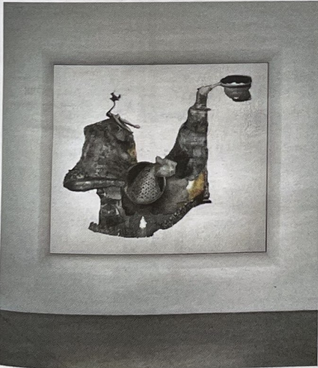
מלכות, 2022. "נשים, מזרחיות וערביות, היו חלק מהפרויקט"