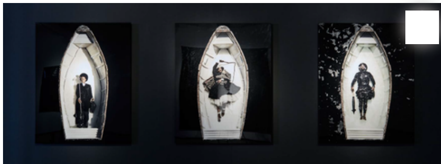
"אני משרטט בעבודות מתחים פסיכולוגיים ורגשיים". מתוך PASSAGE

PASSAGE, הסדרה שאותה הציג מודיסקנג בוונציה, חושפת דימויים של אנשים שחורים שכובים על סירה קטנה שצבעה הלבן בולט מאוד, בתוך ים שמימי שחורים לגמרי. הניגודיות בין השחור ללבן היא הדבר הראשון שמבחינים בו – השחור הוא מאוד שחור והלבן הוא מאוד לבן. הקוטביות הזו יוצרת מתח מידי בתמונה. בנוסף, הדימויים של ים, מים וסירות מתקשרים באופן אסוציאטיבי למהגרים, פליטים, אנשים שמנסים לברוח מגורלם אל מקום טוב יותר. את העבודות צילם מודיסקנג בקייפטאון, במי הבריכות שיוצרת גאות האוקיינוס, עם צוות צילום שלא היה מבייש סרט קולנוע קטן, מצלמה שמוצבת על מנוף ועוד. "הטריגר לסדרה הזו, שבונציה כללה גם עבודת וידיאו, היה המחקר שלי, שלקח אותי בחזרה להגעה של ההולנדים לדרום אפריקה במאה ה-17, והתנועה של עבדים שחורים שהגיעו אליה בתקופת ההולנדים ובתקופת השלטון הבריטי שהחל במאה ה-19", הוא מספר. "מדובר בתקופה של כמה מאות שנים שבה הגוף השחור היה תמיד במקום הנמוך ביותר – וזה מה שבנה חלק ניכר מהדי.אן.איי של התרבות הדרום אפריקנית".