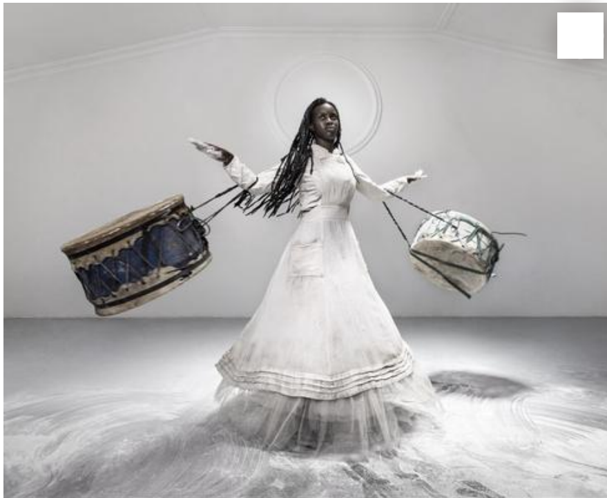
"אותן מכונות שניהלו את דרום אפריקה בעבר - מנהלות אותה גם היום". צילום של מוהאו מודיסקאנג

"אני חושב שמאז פרויקט הגמר שלי בלימודים אני עסוק בביוגרפיה האישית שלי, בדברים שאני עברתי, וזה היה רק טבעי מבחינתי להכניס את עצמי אל העבודות. ניסיתי גם להתרחק מהדימויים של צלמים שחורים שהייתי חשוף אליהם כסטודנט, שבעיניי ייצגו את השחורים באופן די בעייתי. אני כן מתעד בעבודות שלי אנשים אחרים מדי פעם, אבל עם הזמן הבנתי שכלל שאני מכניס את עצמי יותר למקום הזה, כך זה מעורר הזדהות אצל מיליוני שחורים אחרים, בדרום אפריקה ובעולם כולו".