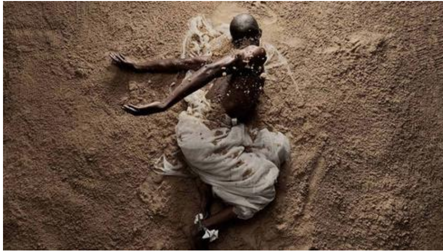
"העבודות מראות כיצד האלימות בדרום אפריקה השפיעה על הגוף השחור שלי". צילום של מוהאו מודיסאקנג

מודיסאקנג אומנם רק בן 34, אבל בעל רזומה מכובד בקנה מידה מקומי וגם בינלאומי. פסגת הקריירה האמנותית שלו עד כה הייתה כנראה לפני שלוש שנים, בשנת 2017, כשייצג את מולדתו דרום אפריקה בביאנלה לאמנות בוונציה – אירוע האמנות העכשווית החשוב בעולם, שמתקיים אחת לשנתיים בעיר התעלות האיטלקית. שלוש עבודות מתוך הפרויקט שהציג בוונציה, PASSAGE, מוצגות גם בתערוכה הנוכחית בתל אביב.