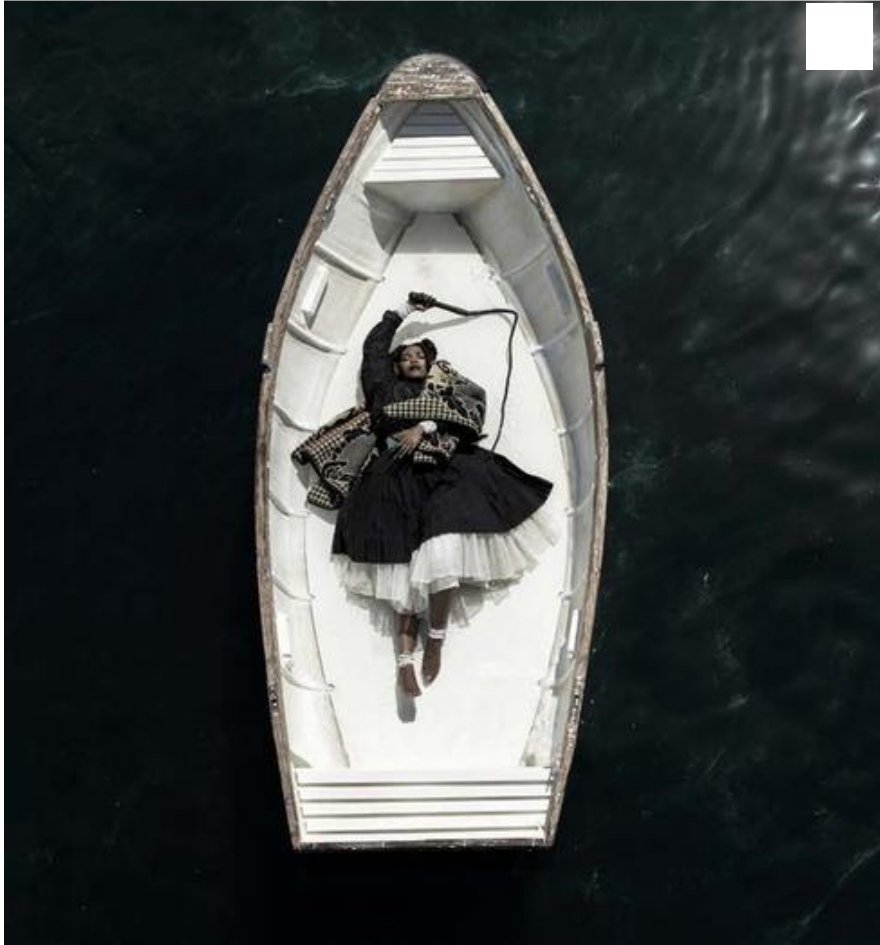
"יש תחושה של צורך להילחם באויב בלתי נראה". מתוך PASSAGE

אתה חושב שהמצב בדרום אפריקה היום טוב יותר מבימי האפרטהייד? "לא. יש הרבה בעיות חברתיות, הרבה אבטלה, הרבה עוני, הרבה שנאת זרים. לא הרבה השתנה, אותן מכונות שניהלו את המדינה בעבר מנהלות אותה גם היום, אבל עכשיו יש איזו תחושה כאילו אתה צריך להילחם באויב בלתי נראה. מה שכן, יש במקביל תמיד גם צורך