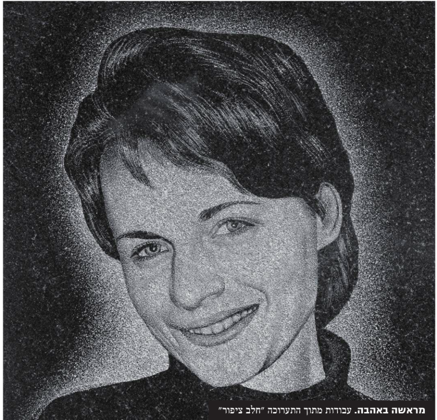
מראשה באהבה. עבודות מתוך התערוכה "חלב ציפור"

במבט ראשון הכניסה לחדר התערוכה יכניס את המבקר לתוך עולם מדומיין שבו הקרקע