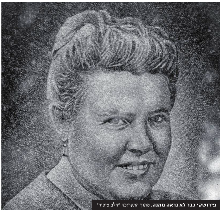
פירושקי כבר לא נראה ממנה. מתוך התערוכה "חלב ציפור"

"חלב ציפור", הגלריה לצילום במוזיאון תל אביב. 22.11'23.5