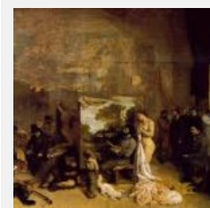
Gustave Courbet The Painter's Studio: A real allegory summing up seven years of my artistic and moral life

מעניין לחשוב על הצילומים הגדולים, הטורדים שלו ביחס לציור של קורבה "The Painter's Studio: A real allegory summing up seven years of my artistic and moral life" 1855. קורבה צייר את הסטודיו כמלא בצופים מהשורה בצד אחד, אנשי אמנות בצד השני ודמות אישה עירומה כמייצגת את מוזות האמנות ולידה ילד. במרכז נראה קורבה מצייר נוף. יאשייב, כך נדמה, מתכתב עם הציור הגדול והחידתי "אלגוריה אמיתית" כמו שהגדיר זאת קורבה.