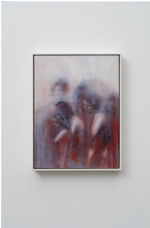
ברכה אטינגר, "רחל-פיאטה-מדוזה" (מס' 3), 2018

אטינגר מציגה שלושה ציורי שמן חדשים – "רחל-פיאטה-מדוזה" (מס' 1, מס' 2, מס' 3) יצירות כמעט אבסטרקטיות של נשים צעירות ומבוגרות. הציורים מטרידים ובו בזמן יש בהם יופי מסתורי, מנחם ומעורר חמלה. הם נדמים כמעין אפריטיף לתערוכה גדולה ומקיפה של אטינגר, או לפחות מעוררים סקרנות לתערוכה כזו.