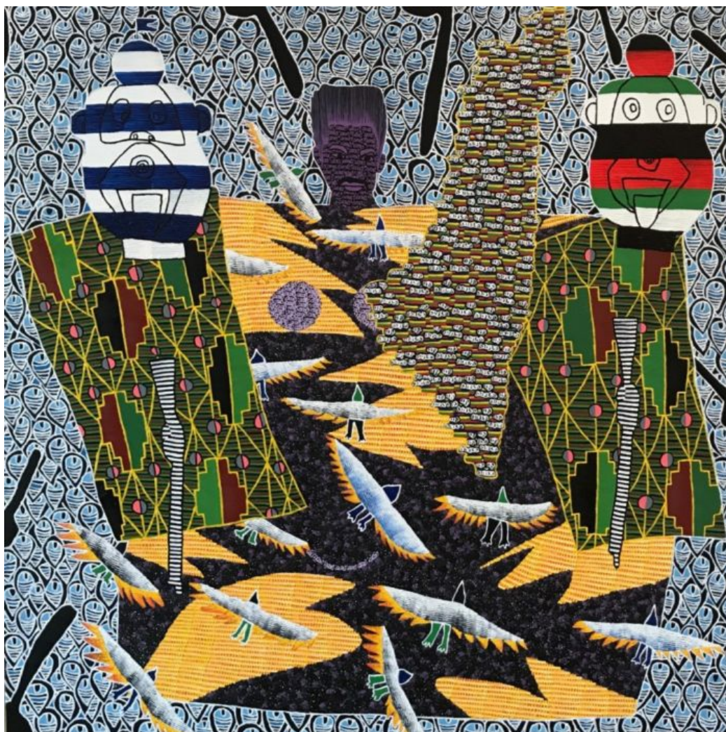
טל מצליח, "ללא בותרת" 2017

"רוב העבודות בתערוכה אינן חדשות, אבל זה מה שעושה אותה: זו הזדמנות פשוט להיכנס לגלריה קטנה במפלס הרחוב בדרום תל-אביב ולהיתקל בחברות ותיקות שלא ראית מזמן, ואז לשתות יחד קפה באמצע היום, ולא רק לפגוש אותן בפייסבוק". רונן אידלמן על התערוכה הקבוצתית בגלריה ברוורמן בתל-אביב