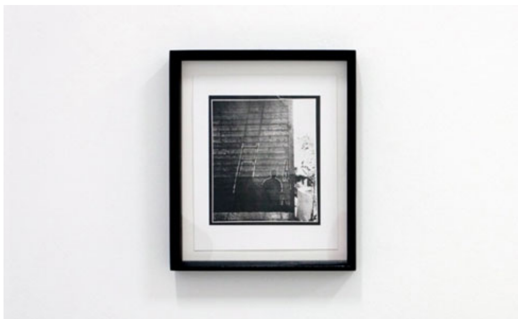
כל מה שהתפוגג. התמונה "הירושימה".

ארבע עבודות מונדריאניות בולטות בחלל, "Full Reflection". העבודות נוצרו מסריקות הדדיות של סורקים. סורק סורק סורק, והדימוי הנתפס הוא רק אור שנדלק וכבה. אור לבן ומסמא, המותיר חותם - גושי צבע גיאומטריים היוצרים כבמעשה אליכמיה עבודות העונות לריבועים הצבעוניים המתכוננים של מונדריאן. שחם יוצר באמצעי שאין לו שליטה מלאה עליו, אך הוא מציע דימוי הנראה נשלט ומכוון. הסורקים האנונימיים יצרו עבודות מרשימות, והן נדברך נוסף בשאלות המאקרו שמעלה התערוכה ביחס בין דימוי למציאות.