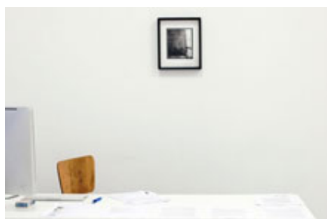
האמת והדמיון. עבודה של אסף שחם

התחביר האמנותי של אסף שחם מבוסס על מה שלעולם לא יהיה ועל מה שהיה פעם אבל כבר איננו. התערוכה שלו מורכבת, אינטליגנטית ומעמיקה במחקר שלה את מדיום הצילום. המילה "צילום" היא צמצום, או יותר נכון הסטה של מה ששחם עושה. מה עושה את התערוכה הזאת לצילום? מדוע אי אפשר לכנות את העבודות של שלם אובייקטים? האם מכיון שלחץ על כפתור ההפעל במכשיר כלשהו?