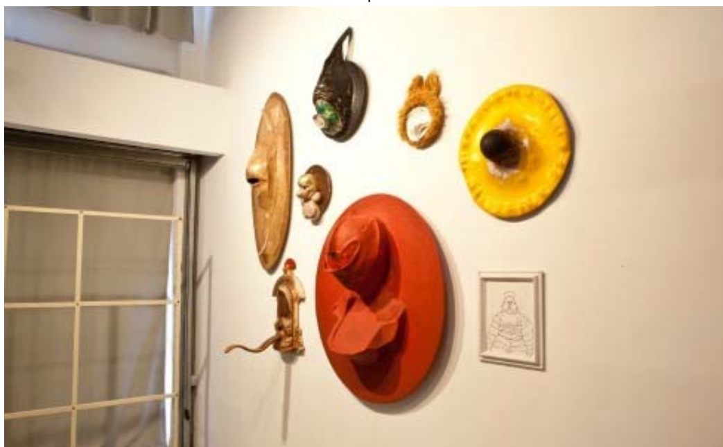
החוויה הבסיסית מגיעה מהחלל עצמו

בקצה המסלול מצוי מבנה קטן ולבן, מעין קפלת תפילה הבנויה בסגנון ארכיטקטוני המשלב בין מבנה בזיליקה נוצרית וקשתות מוסלמיות. על רצפת המבנה מונח שטיח אוריינטלי, המרמז על אופציה לתפילה. המבנה הזה, המשלב בין חילוני ורליגיזי, המכליא בין סגנונות, דתות ותרבויות באופן כה אורגני, ממצה פנים רבות של התערובה, שבה נארגים יחד דימויים ממקורות שונים, אדריכלות עם פיסול, רדי מייד עם עבודת יד, איקוני ועממי, חד פעמי ופופולרי. מההכלאות נוצר משהו חדש - שתמיד היה שם אך בה בעת מתקיים לראשונה.