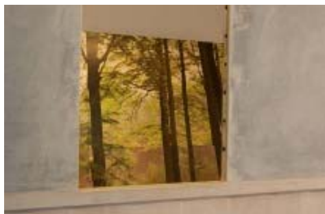
מזכרת ממקום רחוק. "חזיונות"

בתערוכתו "חזיונות" מוליך שי עיד אלוני את הצופה בין דמויות פולחניות, פסלים ואובייקטים מתרבות הצריכה, אבל אלה הם השינויים שהוא עשה לחלל גלריה ברוורמן שבאמת מרימים את התערוכה