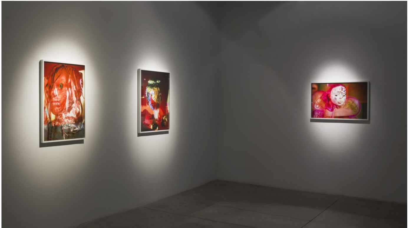
"לילית" בגלריה ברוורמן. הערה מחויכת וקלילה על המצב